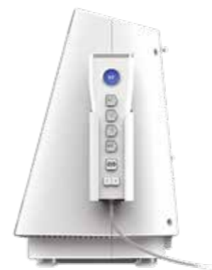
Пульт дистанционного управления для генератора Symplicity G3