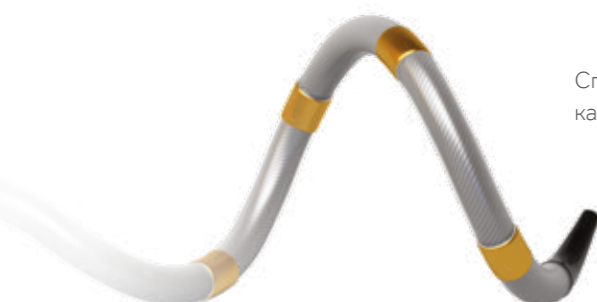
Спиральная форма катетера